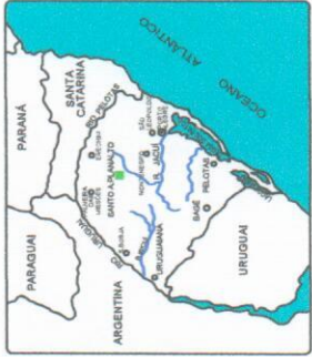
LOCALIZAÇÃO DA CIDADE SEM ESCALA