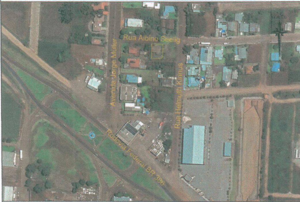
MAPA DE LOCALIZAÇÃO E SITUAÇÃO - Sem Escala