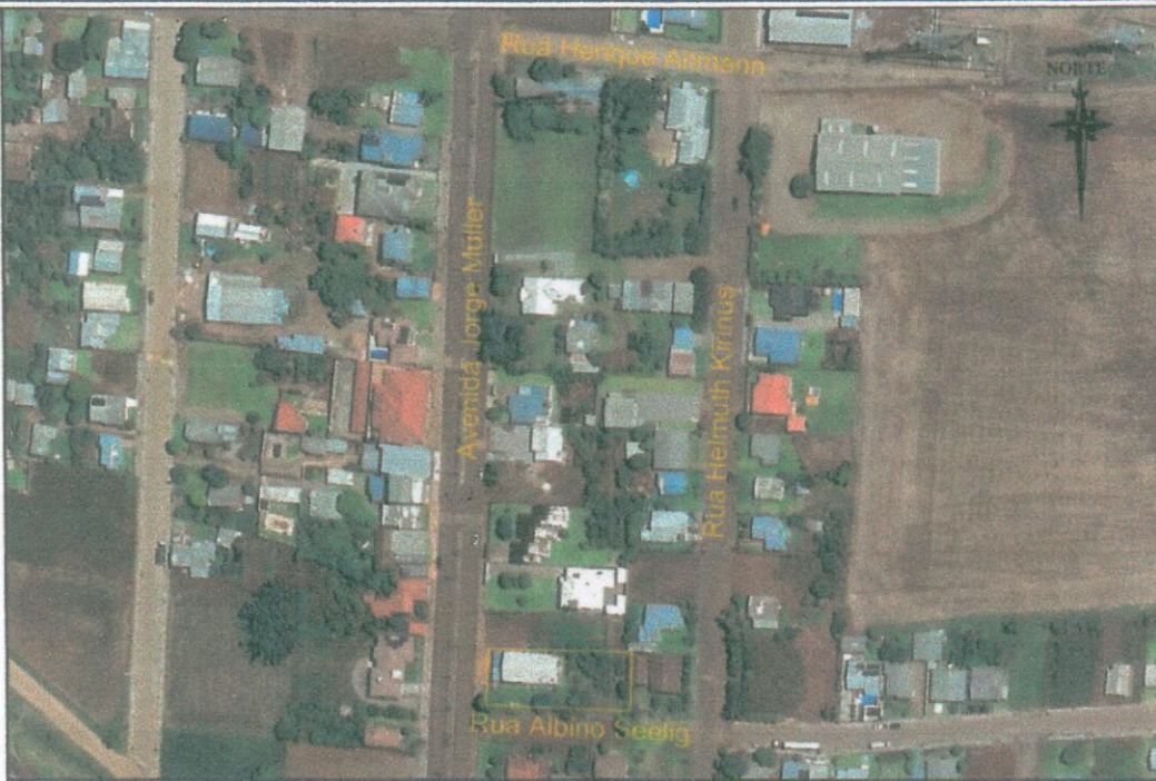
MAPA DE LOCALIZAÇÃO E SITUAÇÃO - Sem Escala